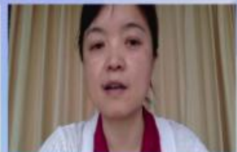
董捷教授 北京大学第一医院